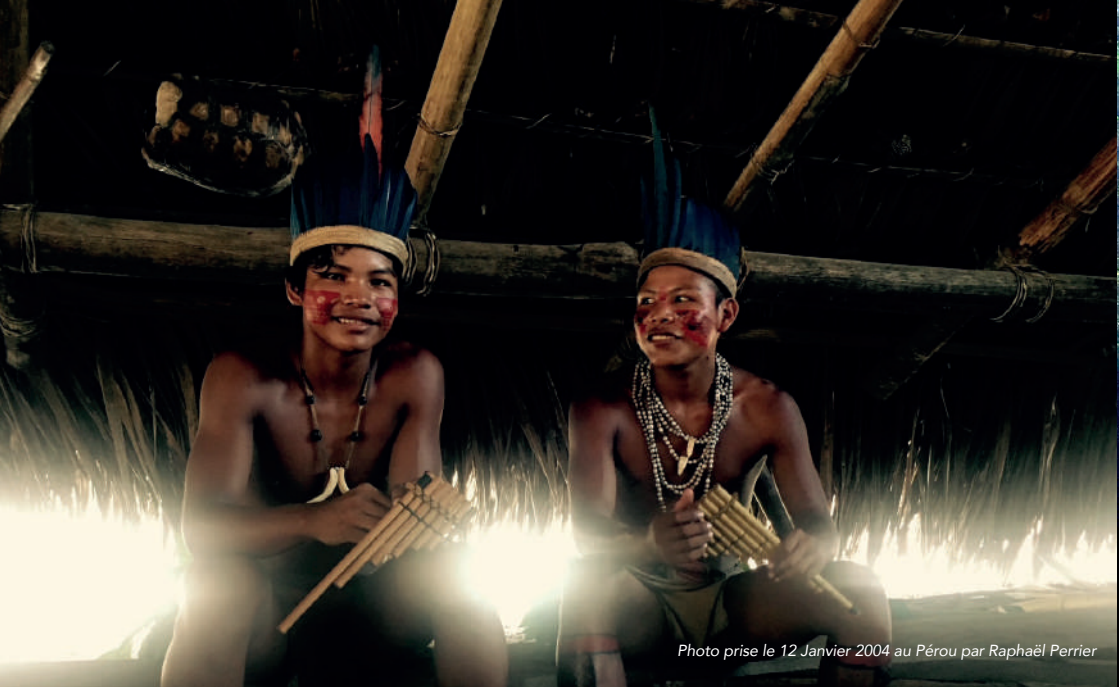
Photo prise le 12 Janvier 2004 au Pérou