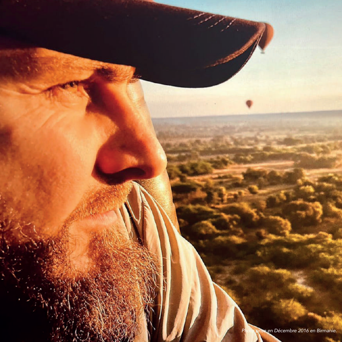
Photo prise en Décembre 2016 en Birmanie.