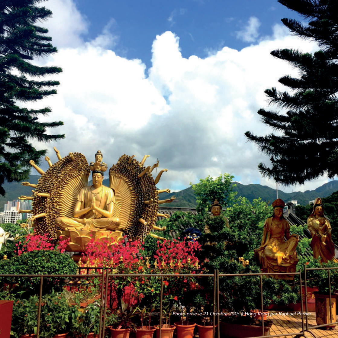
Photo prise le 21 Octobre 2015 à Hong Kong