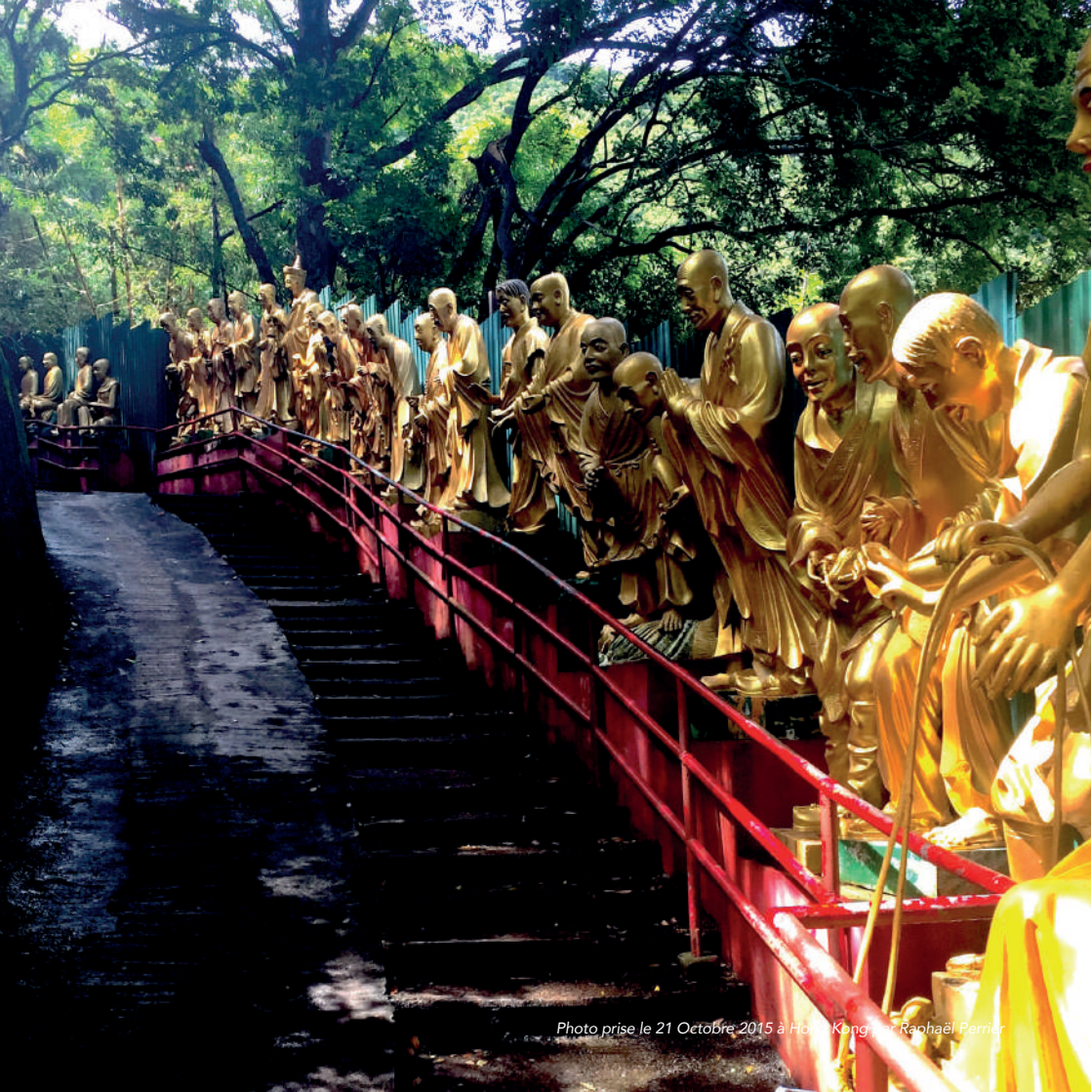
Photo prise le 21 Octobre 2015 à Hong Kong